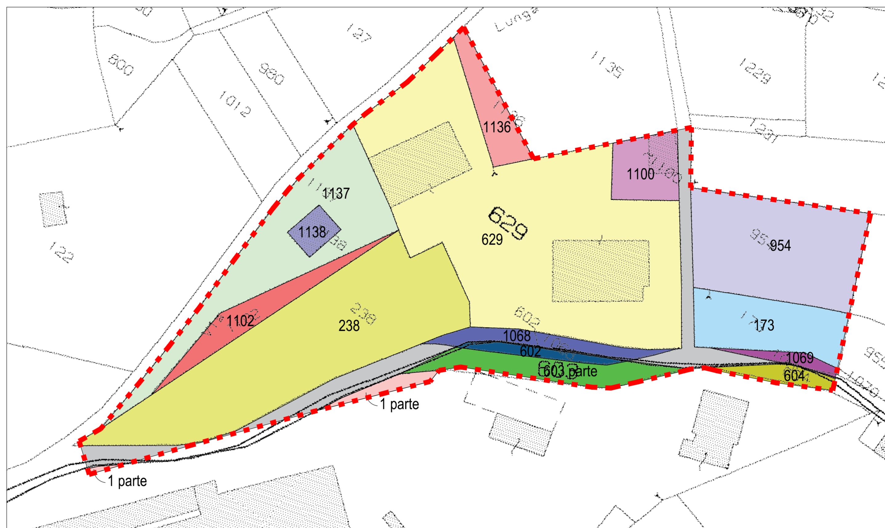
ESTRATTO CATASTALE CON INDIVIDUAZIONE DELL'AMBITO DI P.E.C.

File: \VARIANTE_PEC_20190729_GENERALE.DWG