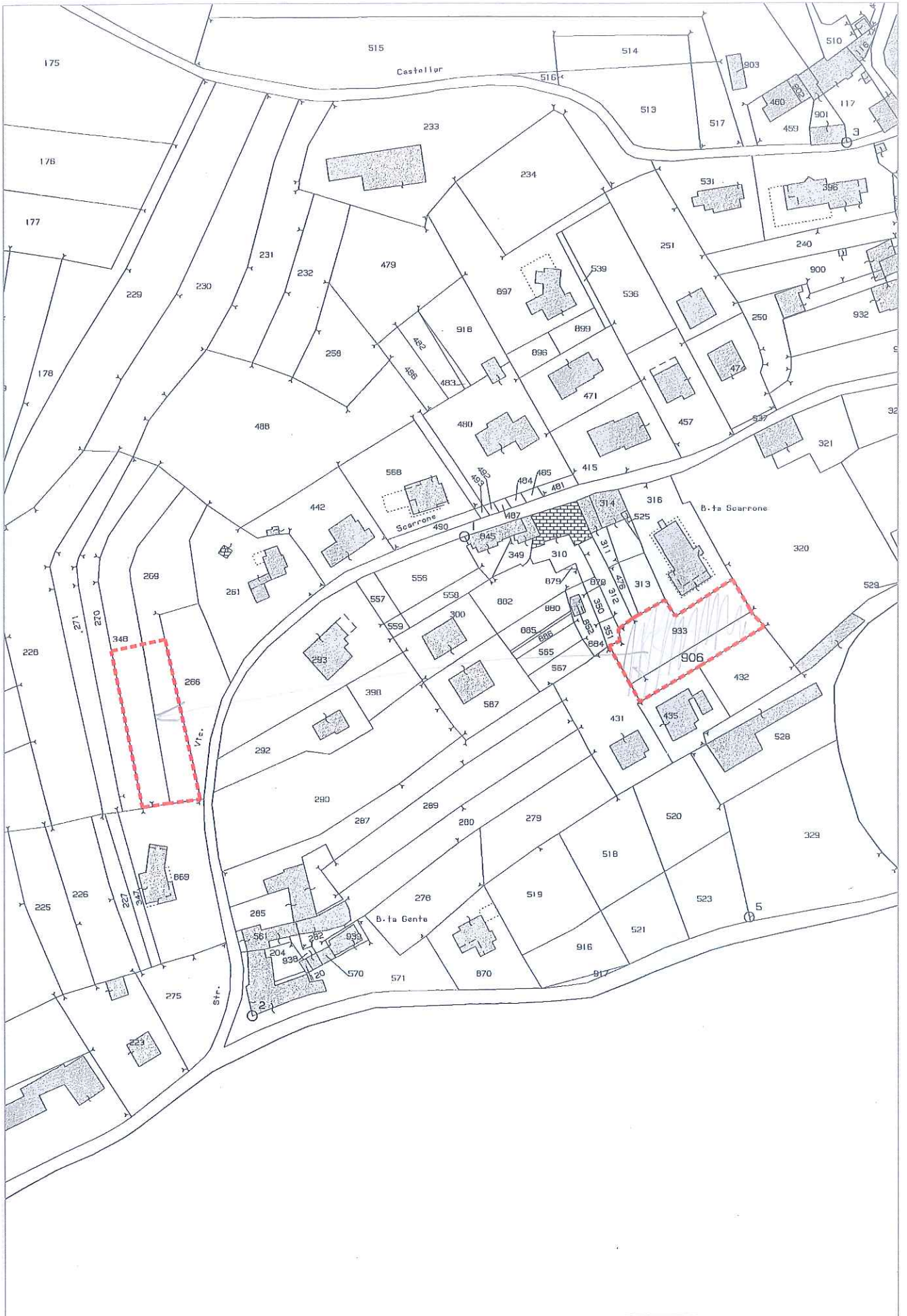
ESTRATTO MAPPA CATASTALE Scala 1:2.000